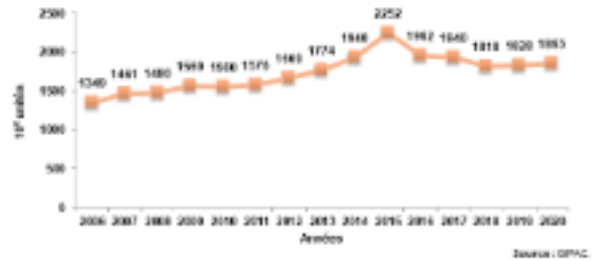
Evolution de la production des œufs de consommation