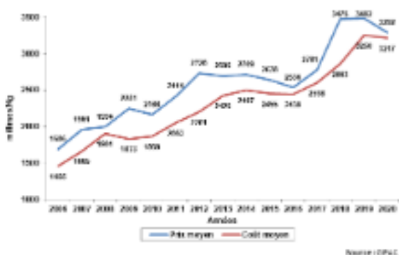
Evolution du coût moyen et du prix moyen à la production du poulet de chair