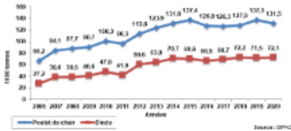
Evolution de la production des poulets de chair et des dindes