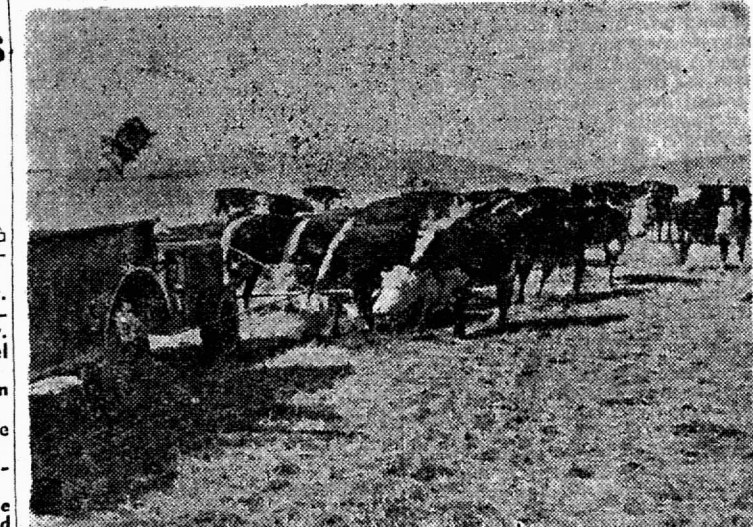
VISION DE SECHERESSE... En Colfernie, un troupeau de bovins suit, en broutant, le véhicule qui déverse sur les chaumes desséchés un mélange d'urée et de gres.

Le rapport moral approuvé, l'Assemblée passe à la désignation de