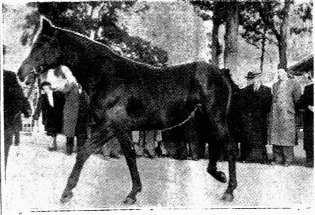
منظر من مناظر هذا المود الذي اجاره معالي وزير الفلاحة الفرنسية لمعالي وزير الفلاحة التونسية الذي ترويه اعلا

أحاز معالي وزير الفلاحة بحكومة الفرنسية معالي وزير الفلاحة للفرنسي المود الألكسري « لوكصور » سني الدم. وسنعه مصلحة الانتاج الجواحي لارب. الحبل الاغليزية الفية الدم الدين يرغون تلقيح افراسهم.