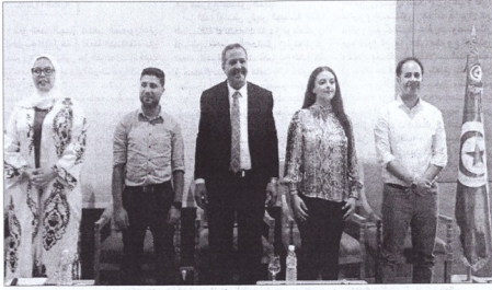
الديمقراطي لحزب العمل والانجاز، وبين أن كل تجارب الانتقال الديمقراطي في العالم عرفت أزمات تكن أغلب الدول التي عاشت هزات خرجت منها قائما هو الشأن بالخصوص في العراق واليمن، كما أن وائسادا اليوينا حلقنا الإلتحاق الاقتصادي بعد المعجز الكبير وفسر، الشوم يمكن أن تحدث في تونس.

وأضاف إلى ذلك الثورة سيهدم الحزب حسب قول المكي بموقع الأسرة لأن كل السياسات الاجتماعية والاقتصادية يجب أن تروى إلى رغبة الأسرة، وفسر أن هدفهم لإسقاط النجح هو تحقيق رفاه الأسرة التونسية، وذكر أن حزبه يطرح فكرة أخرى وهي أخلافة العمار التونسية، لأنه ما حددهه للكتاب، كتاب مضمون في الف